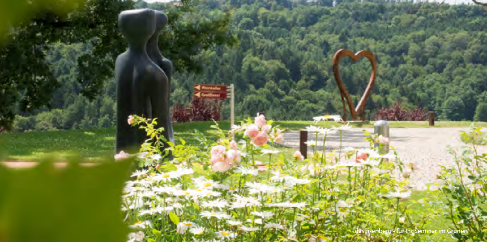
dasEisenberg - für Ihr Seminar im Grünen

104 BETTEN • HOTEL MIT RESTAURANT UND ÜBERDACHTER TERRASSE • WINTERGARTEN • LANDHAUS STADL • WEINGARTEN-RESTAURANT • NATURSPA MIT PANORAMA-AUSSENPOOL • FITNESSRAUM LOUNGE-TERRASSE • 20 HEKTAR GARTENLANDSCHAFT